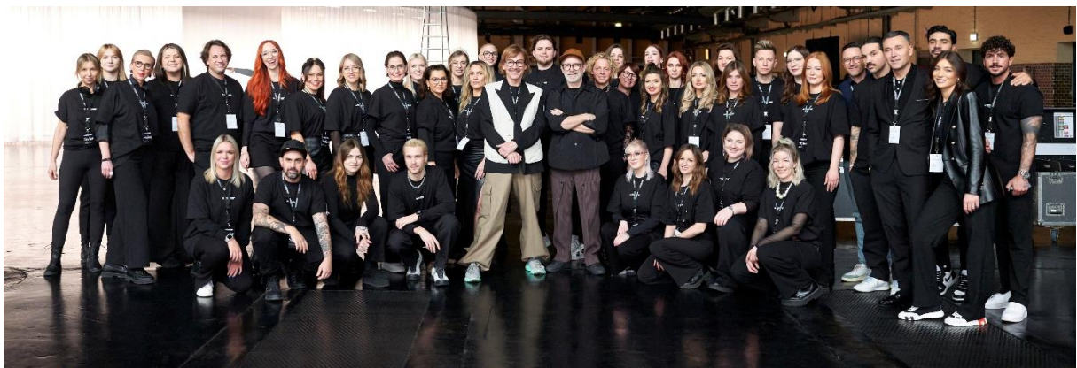
Internationales Fashion Week-Team von La Biosthétique – 150 Friseure & Visagisten aus 7 Ländern kreieren für 9 Shows alle Hair- und Make-up Styles bei der Berlin Fashion Week

Auch die Designerlabels Olivia Ballard, Marke, Dennis Chuene, Bobkova, DZHUS und Namilia zeigten ihre Trendkollektionen für die kommende Wintersaison im Showcase NEWEST. Allesamt Designer*innen, die dafür bekannt sind, in ihren Kollektionen die Grenzen des Konventionellen herauszufordern und mit ihren Kreationen nicht nur Fragen aufzuwerfen, sondern auch Diskussionen über die Interpretation von Mode und die gesellschaftliche Selbstinszenierung zu provozieren. Kurz: Den rund 150 internationalen La Biosthétique Stylist*innen und Visagist*innen bot diese facettenreiche Mode der Berlin Fashion Week eine wahrhaft kreative Spielwiese, um schon jetzt die Trends der nächsten Herbst-/Winter-Saison 2024/25 aktiv mitzugestalten.